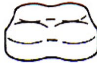
Type Y 2 Rangées égales et côte à côte